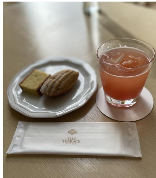
チェックインは、ビクトリア （専用ラウンジ）