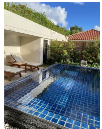
客室に付いたプライベートプール。