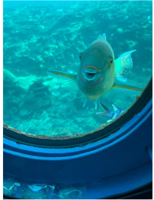
ブセナ海中公園の海中展望塔。

料金やプランは時期によって大きく変わるため、 予約前に複数の予約サイトで条件を比較してみてください。