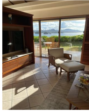
1010号室の扉を開けた瞬間。