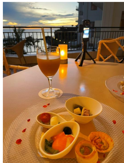
クラブラウンジでのアペリティフタイム。

夕暮れの空がゆっくりと色を変える中で、食事の前のひとときを、静かに味わう時間でした。